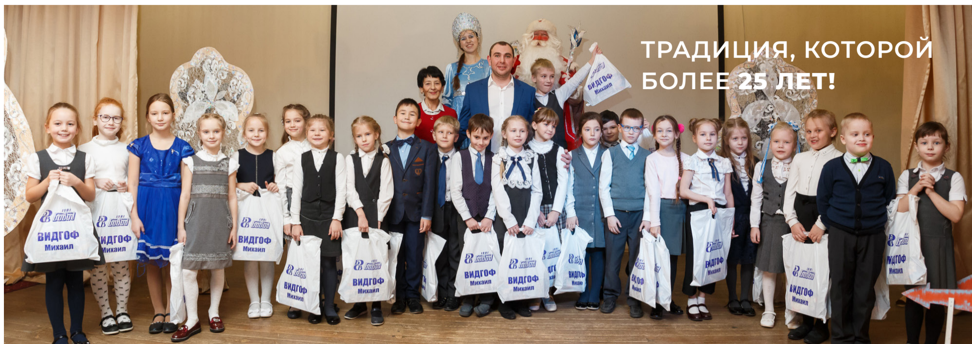
▲ 13 000 новогодних подарков от компании «БОВИД» получили дети Тракторозаводского района в 2020 году