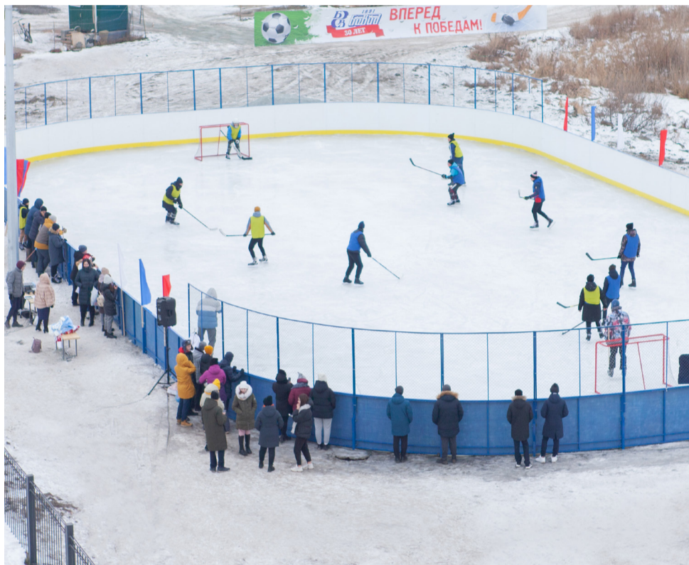
▲ В зимний сезон хоккейный корт открыт для всех желающих, в вечернее время работает освещение