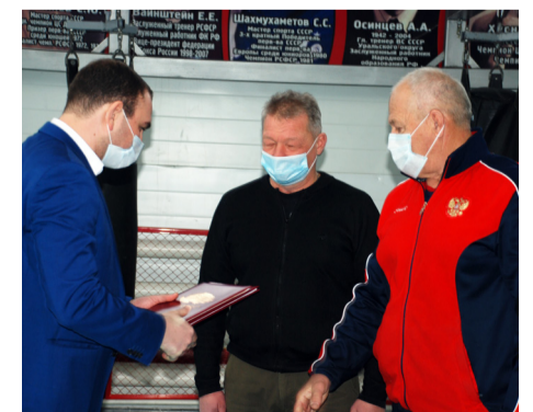
▲ Награждение тренерского состава школы «Алмаз» премиями ЗСО