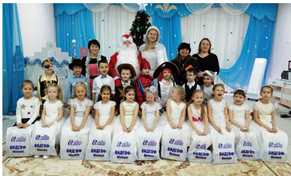
▲ Для ребят устроили утренники с Дедом Морозом и Снегурочкой