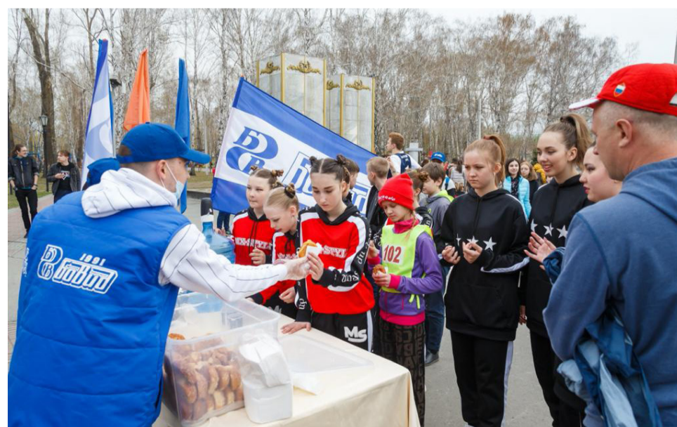
▲ Во время проведения районной легкоатлетической эстафеты компания «БОВИД» угощает участников сладкими булочками и чаем