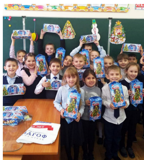
▲ Подарки выдают в школах, спортивных секциях, социально-реабилитационном центре и техникуме-интернате