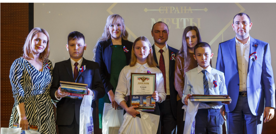
▲ Специальные призы вручают педагогам, подготовившим победителей