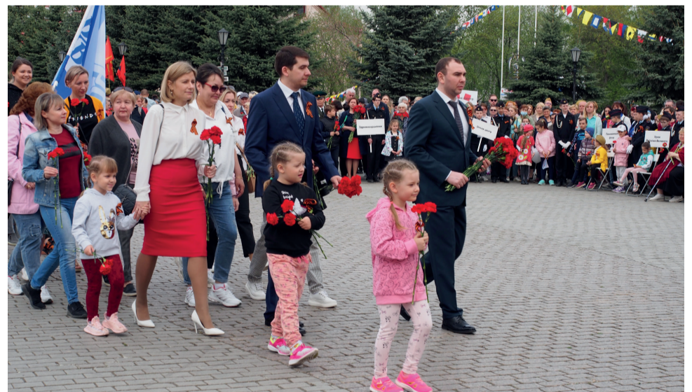
▲ Возложение цветов к памятнику «Тракторостроителям, павшим в боях за Родину»