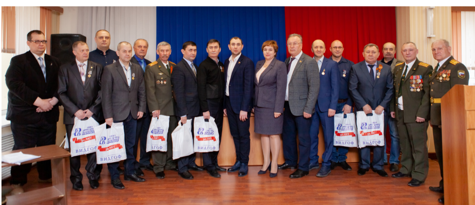
▲ Награждение ветеранов военной службы на Северном Кавказе