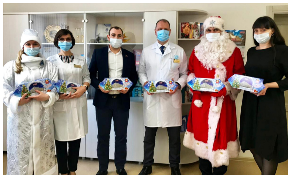
▲ 400 подарков к Новому году передано детям врачей «красной зоны»