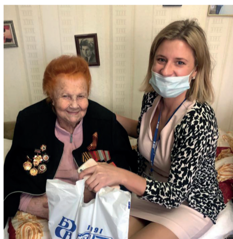
▲ Поздравление ветеранов — добрая традиция