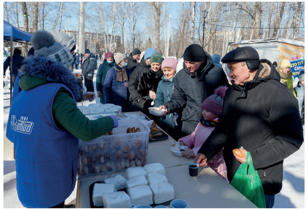
▲ По доброй традиции во время праздничных гуляний на Масленицу компания «БОВИД» организует в Саду Победы работу полевой кухни