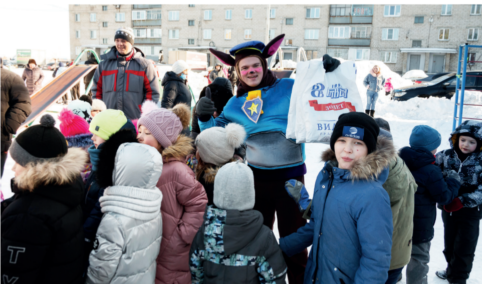
▲ По просьбе жителей микрорайона ОПМС-42 на Масленицу организован праздник двора с аниматорами и угощениями