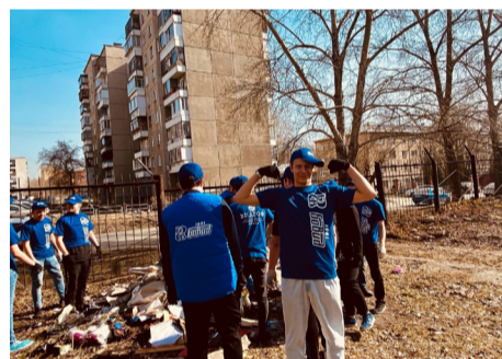
▲ Компания «БОВИД» предоставляет спецтехнику для проведения субботников в образовательных организациях района