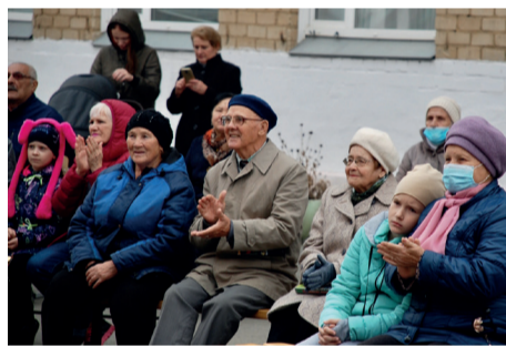
▲ Ко Дню пожилого человека для жителей района организована праздничная программа и вручены подарки от Михаила Видгофа