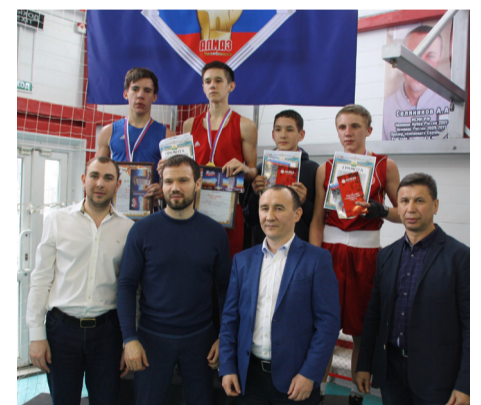
▲ Компания «БОВИД» ежегодно выступает спонсором турниров, которые проводит школа бокса «Алмаз»