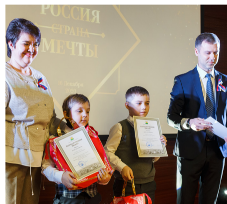
▲ Сочинения на конкурс прислали более 80 тысяч школьников Челябинска, среди них выбрали 12 призёров. Общий призовой фонд конкурса — более 500 тысяч рублей