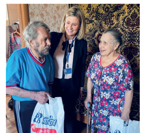
▲ В пандемию коронавируса вручено 2000 проднаборов